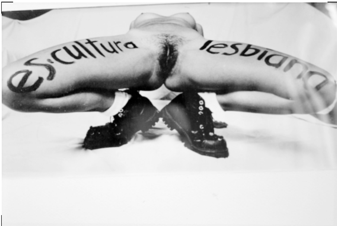
LSD Es cultura lesbiana 1994